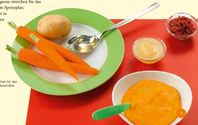
Wenige Zutaten reichen für den Gemüse-Kartoffel-Fleisch-Brei.

Gemüse in seiner bunten Vielfalt ist der Hauptbestandteil des Mittagessens. Führen Sie eine Gemüseart ein und testen Sie die Verträglichkeit. Bewährt hat sich die milde und leicht süß schmeckende Karotte oder der Kürbis. Aber auch andere nährstoffreiche Gemüsearten wie Brokkoli, Blumenkohl, Kohlrabi oder Fenchel sind gut geeignet. Zucchini hilft bei hartem Stuhl. Gegen Ende des ersten Lebensjahres können schon Hülsenfrüchte wie rote oder gelbe Linsen oder Erbsen den Speiseplan ergänzen. Stark blähendes Gemüse wie Lauch, Weiß- oder Rosenkohl besser erst im zweiten Lebensjahr anbieten. Abwechslung darf sein - nutzen Sie die Neugier Ihres Babys und bereiten Sie den Brei mit verschiedenen Gemüsearten der Saison zu. Nutzen Sie Lebensmittel aus der Region.