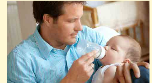
Ihr Baby weiß wie viel es braucht – Reste dürfen in der Flasche bleiben!

Milchpulver mit dem entsprechenden Messlöffel aus der Packung, streichen Sie den Löffel mit einem Messerrücken ab und geben Sie das Pulver zu dem Wasser in der Flasche. Verschließen Sie die Flasche mit dem Deckel, schütteln alles gut durch und füllen mit dem restlichen Wasser auf die Trinkmenge auf. Die ideale Trinktemperatur ist lauwarm, etwa 37 °C, das entspricht der Körpertemperatur. Geben Sie zum Prüfen ein paar Tropfen aus dem Fläschchen auf die Innenseite Ihres Handgelenks.