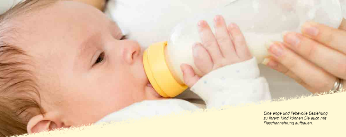
Eine enge und liebevolle Beziehung zu Ihrem Kind können Sie auch mit Flaschennahrung aufbauen.