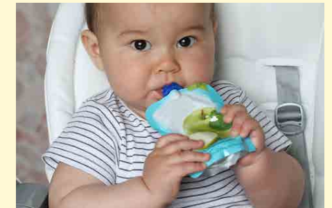
Frische Früchte sind besser als Quetschobst aus der Tüte!

Das Sagen von Quetschobst aus der Aluminium- oder Plastiktüte trägt weder zu einem guten Essverhalten noch zu einem bewussten Umgang mit unserer Umwelt bei. Die Mischung aus Obstsüße und Obstsäure kann durch das dauernde Lutschen die Kariesgefahr erhöhen.