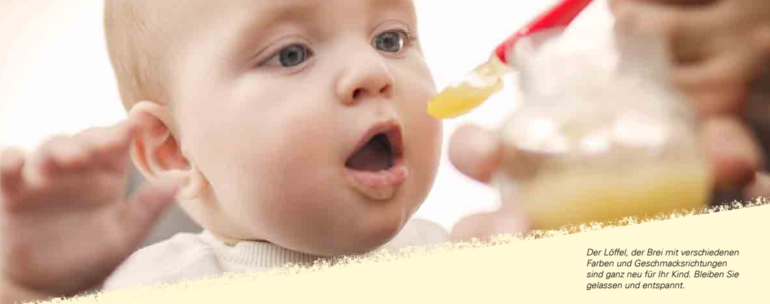
Der Löffel, der Brei mit verschiedenen Farben und Geschmacksrichtungen sind ganz neu für Ihr Kind. Bleiben Sie gelassen und entspannt.