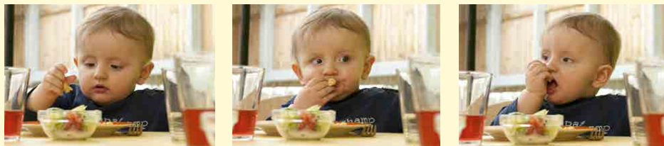
Noch ist alles neu und spannend. Begeistern Sie Ihr Kind jetzt für die Vielfalt von Lebensmitteln.